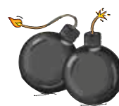
bom - bommen

je schrijft: bo + men = bomen bo + m + men = bommen